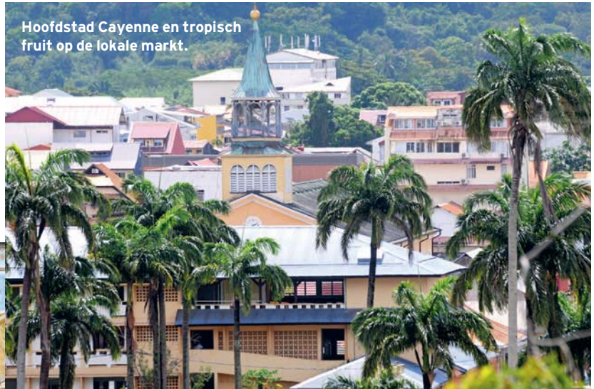
Hoofdstad Cayenne en tropisch fruit op de lokale markt.

De peperbolletjes komen uit Brazilië, maar heten cayennepeper omdat ze hier al eeuwen verscheept worden