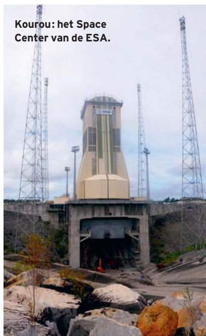
Kourou: het Space Center van de ESA.